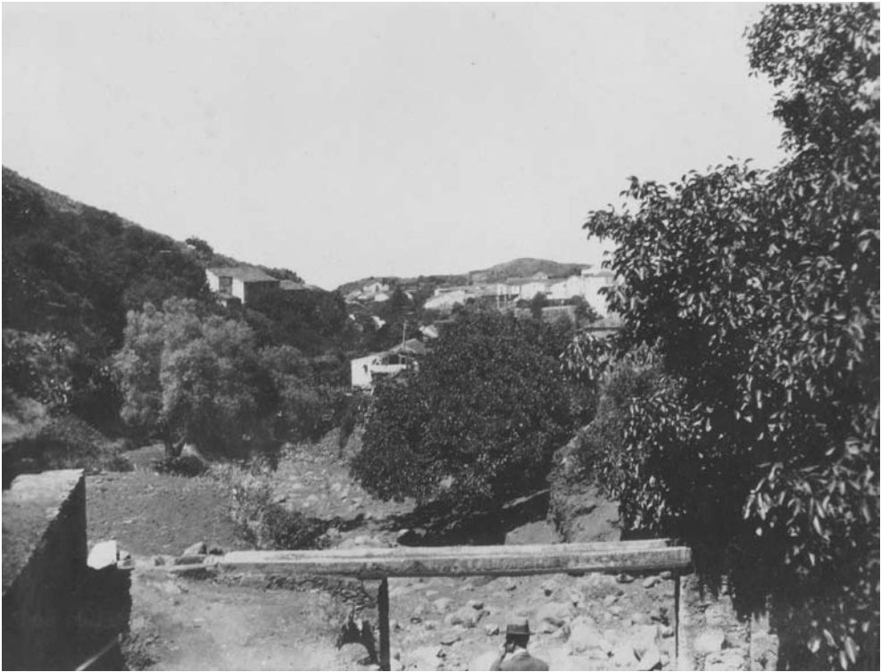
Figura 1. Viejo canal de tea que cruza el Barranco del Agua y aún se conserva en las proximidades del barrio de San Juan. Archivo FEDAC.

[...] atraviésale dos pequeños nacimientos, uno llamado Río, porque lo fué antes del volcán de 1701 7 , y el otro conocido por Badajos ; sus aguas son conducidas en Arteaga por una sociedad, que después de facilitar las necesarias al pueblo, utiliza las sobrantes en el riego de varios trozos de tierra. 8