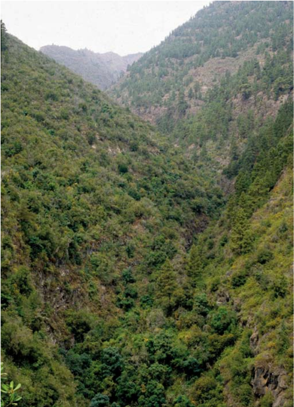
Figura 6. Vista panorámica del Barranco del Agua. Se aprecia el monteverde seco en la ladera orientada al Norte, el monteverde húmedo en el cauce y el pinar en la ladera que mira al Sur.