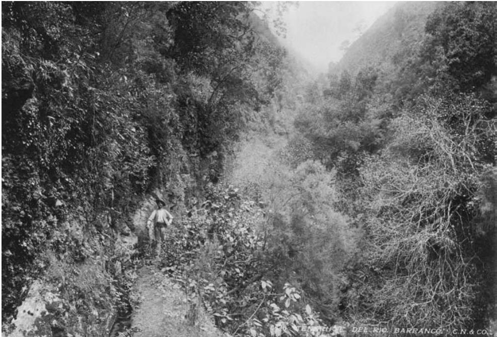
Figura 4. Barranco del Río. Fotografía de Carl Norman (1893). Archivo FEDAC.

el más leve temor o peligro. En todos lados es oído el murmullo de los numerosos torrentes que, en su curso descendente, aquí y allí caen en graciosas cascadas, o forman, en sombrías cubetas, cristalinos charcos de duendes. Tal fue la impresión que este magnífico barranco hizo en un reciente viajero y consumado naturalista, que entusiasmado declaró que este era el paraje más agradable del mundo. 18