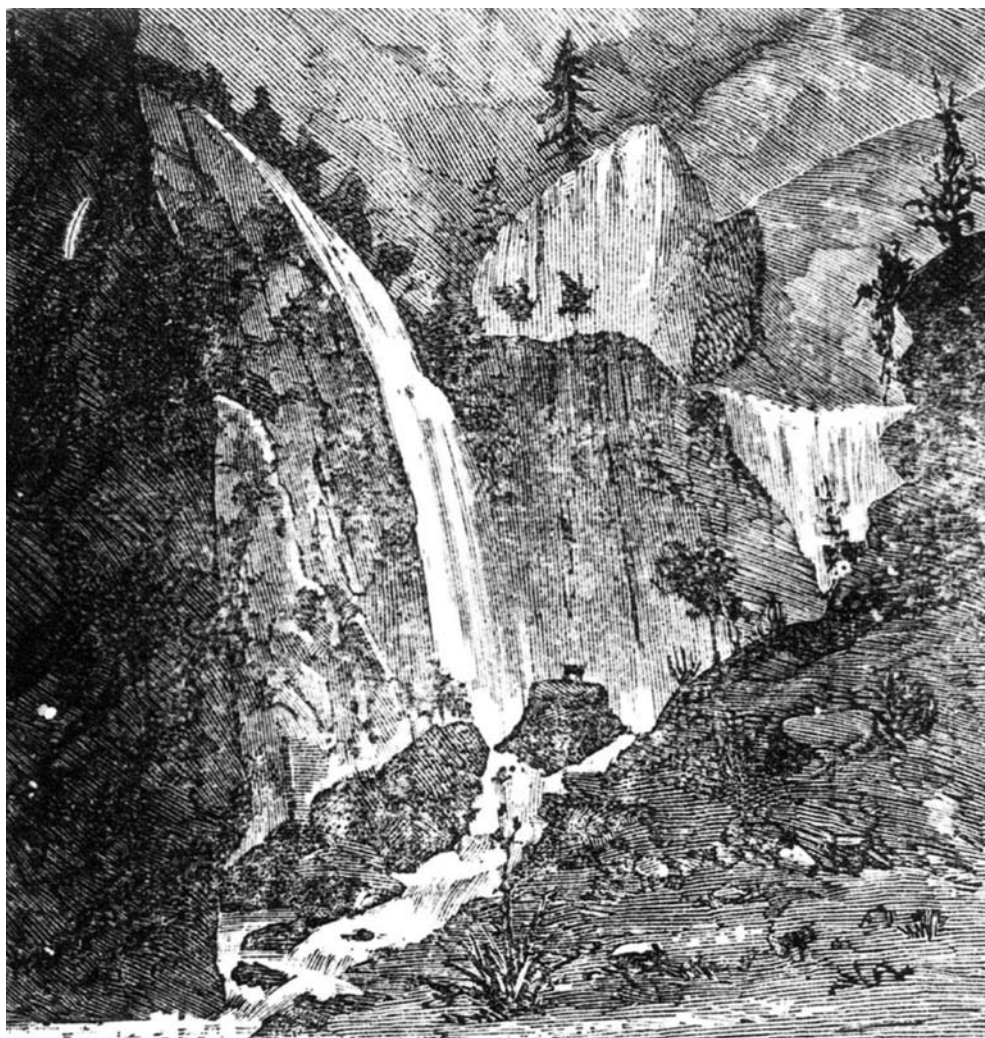
Figura 3. Grabado del “Barranco de las aguas; distrito de Güimar”. Reproducido en La Ilustración de Canarias (1883).

pero á la vez, puede valerse éste de senderos practicables por donde, sin peligro, le es fácil recorrer todos los descriptos sitios. 15