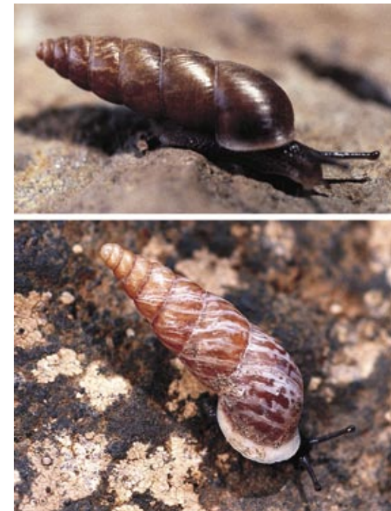
En la parte superior, Napaesus exilis , de Gran Canaria, uno de los caracoles más esbeltos del género. Debajo, Napaesus variatus , de Tenerife, mostrando el contraste de los dos colores de su concha.

riesgo de extinción. Una es Hemicycla saulcyi , que de momento sobrevive, junto con Napaesus isletae , en La Isleta (al norte de Las Palmas de Gran Canaria), estando ambas “en peligro crítico (CR)” 19 según los criterios establecidos por la UICN. Otra especie también muy amenazada, aunque la Dirección General de Medio Ambiente de nuestra Comunidad Autónoma haya realizado alguna actuación puntual en su favor, es la especie “tipo” del género, Hemicycla plicaria , de Tenerife, que también sobrevive milagrosamente; en este caso, en una mínima área de alrededor de 10 km 2 , en el triángulo formado por Candelaria, Las Caletillas e Igueste de Candelaria.