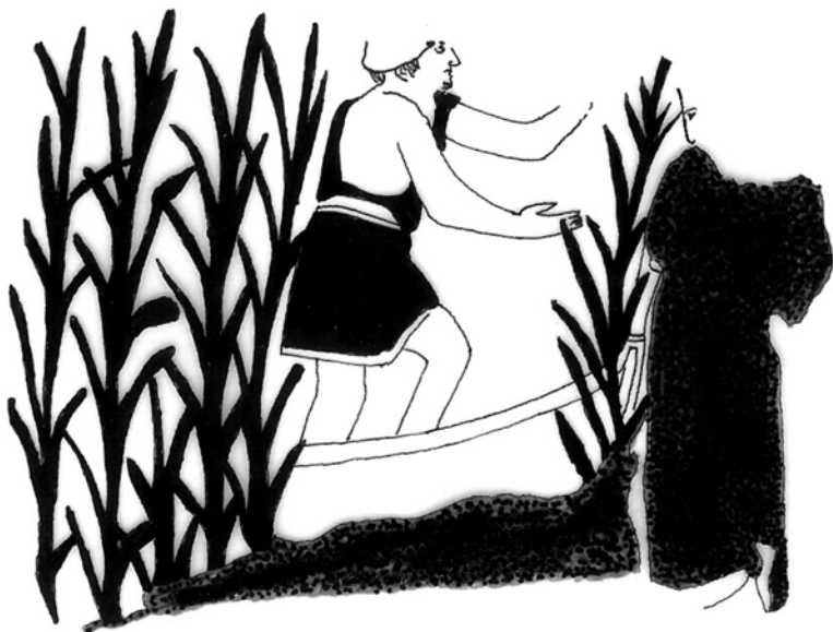
Fig. 1. Lécito de Harvard: las negras aguas del Aqueronte.

en un vaso de la Universidad de Harvard 16 (ilustración 1). Llega incluso a lamer la propia tumba en un número interesante de representaciones 17 , otorgando su plena razón de ser al barquero infernal.