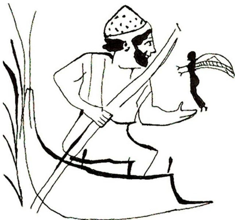
Fig. 4. Lécito de Oxford: Caronte y un eidolon .

desde el más allá velen por los vivos y como máximo ofrecen algunas informaciones a quien como Odisea, en la Nekyia demuestre la osadía (o quizá la estupidez) de invertir tiempo y esfuerzo en molestarlos en consultarlos.