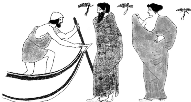
Fig. 3. Lécito de París: Caronte prepara el embarque.

En medio de las aguas se perdió la identidad quizá disuelta en ellas por medio de ese poder de descarnar y licuar que las caracteriza. Cumplida la metamorfosis se anulan las diferencias, madres y guerreros, niños y ancianos son todos iguales, insignificantes y espectrales miniaturas que no inspiran ni admiración ni mucho menos temor.