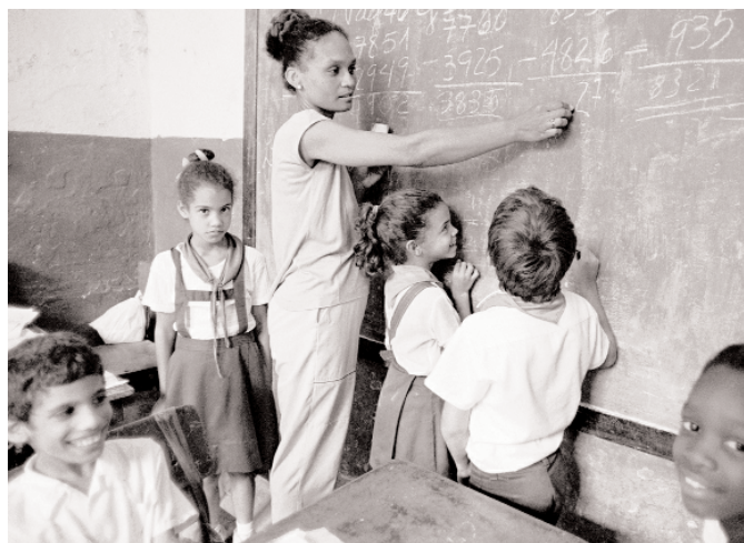
Escuela en Cuba

Marta Scarpato Consultora Especial sobre Igualdad y Derechos Sindicales Internacional de la Educación