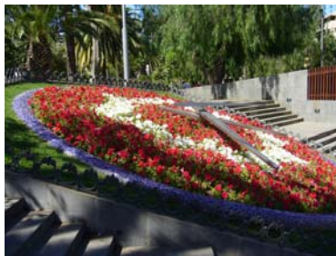
Relógio de Flores . Parque García Sanabria (Santa Cruz de Tenerife)

Existe uma ampla oferta de alojamento, com uma boa relação qualidade-preço tanto na área metropolitana