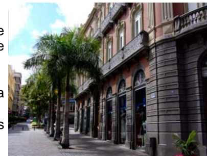
Casa Elder (Santa Cruz de Tenerife)

(Santa Cruz de Tenerife e São Cristóbal de La Laguna), como nas zonas turísticas da ilha.