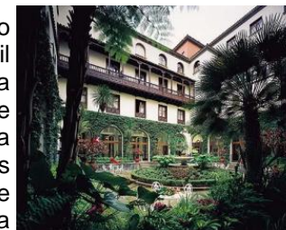
Pátio interior Hotel Mencey (Santa Cruz de Tenerife)

No mesmo sentido, é fácil aproximar-se a um sem-fim de rotas em plena natureza pelas áreas de pinhal e madresilva, uma “floresta fóssil” do Terciário, hoje