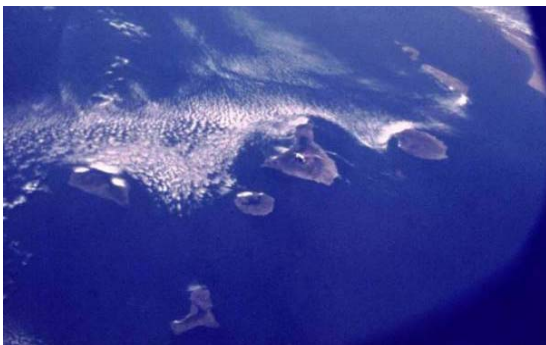
Ilhas Canárias (Foto Satélite)

O Departamento de Filologia Inglesa e Alemã da Universidade de La Laguna, em colaboração com o Departamento de Filologia Francesa e Românica, propõem-se como organizadores do VIII Congresso Internacional da Associação Europeia de Línguas para Fins Específicos (AELFE) durante a primeira semana de Setembro do ano 2009, com o lema “As LFEs perante o desafio da convergência europeia”.