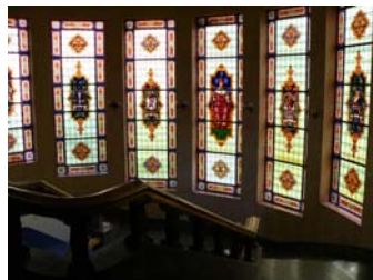
Hall Centrale della ULL

I motivi che ci hanno spinti a presentare la nostra proposta si possono riassumere in due punti: da una parte una considerevole quantità di professori del nostro dipartimento ha partecipato ai Convegni AELFE realizzati fino ad oggi. Dall'altra parte, l'insegnamento di LFE è presente all'Università de La Laguna da più di 125 anni, quando fu incluso l'insegnamento dell'inglese negli