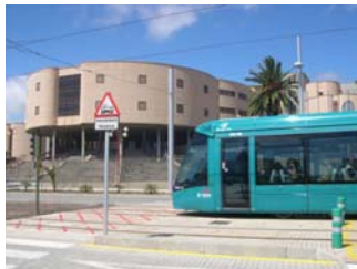
Vista parziale Campus di Guajara

L'accesso alla EUCE, localizzata nel Campus di Guajara, tra Santa Cruz de Tenerife e San