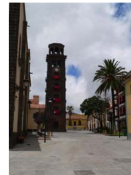
Torre Chiesa della Concezione (La Laguna)

L'Isola, con un clima molto privilegiato, può vantare delle spiagge ideali per fare il bagno, equamente divise tra la costa nord e la costa sud.