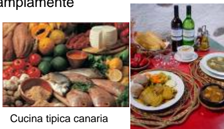
Cucina tipica canaria

A Tenerife, la cucina internazionale è ampiamente