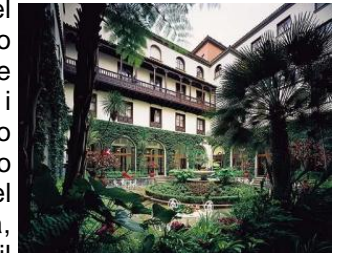
Patio Interno Hotel Mencey (Santa Cruz de Tenerife)

nelle aree di Pinar (pineto) e Laurisilva, un "bosco fossile" del Terziario, oggi scomparso dalla zona del Mediterraneo, o conoscere delle località di indubbio incanto come Garachico o La Orotava, nel nord dell'isola, oppure visitare il Parco Nazionale di Las Cañadas