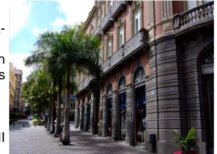
El VIII Congreso de AELFE

Cristóbal de La Laguna), como en las zonas turísticas de la isla.