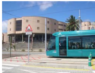
Vista parcial Campus de Guajara

El lugar elegido como sede del Congreso es la Escuela Universitaria de Ciencias Empresariales (EUCE). En este Centro, tanto en la Diplomatura de Empresariales como en la de Turismo, se da la circunstancia de que confluyen las tres lenguas extranjeras que se imparten de forma oficial en los estudios de la ULL: alemán, francés e inglés. Este hecho refleja quizás mejor que cualquier otro la implantación que han llegado a alcanzar las LFE.