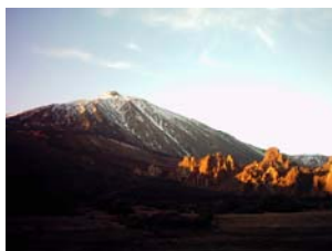
El Teide (Tenerife)

o La Orotava, en el norte de la isla, o bien visitar el Parque Nacional de Las Cañadas del Teide, que alberga el impresionante volcán que le da el nombre y que constituye la cota más alta de España.