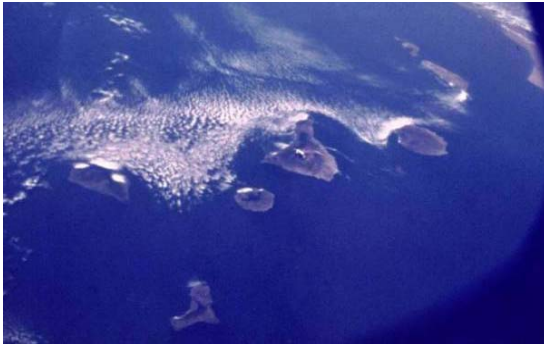
Islas Canarias (Foto Satélite)

El Departamento de Filología Inglesa y Alemana de la Universidad de La Laguna (ULL), en colaboración con el Departamento de Filología Francesa y Románica, se proponen como organizadores del VIII Congreso Internacional de la Asociación Europea de Lenguas para Fines Específicos (AELFE) durante la primera semana de septiembre del año 2009, con el lema “Las LFE ante el reto de la convergencia europea”.