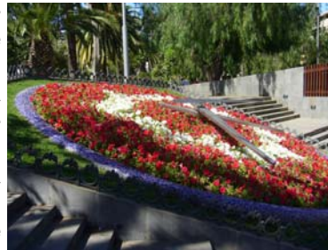
Reloj de Flores. Parque García Sanabria (Santa Cruz de Tenerife)

Existe una amplia oferta de alojamiento, con una buena relación calidad-precio, tanto en el área metropolitana (Santa Cruz de Tenerife y San