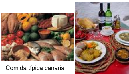
Comida típica canaria

Igualmente, es recomendable aprovechar la estancia en Tenerife para hacer una visita a otras Islas.